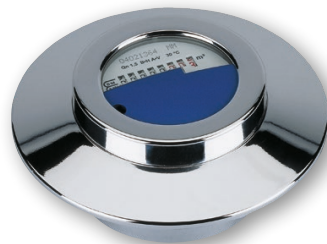
UP-Kompaktzähler für modulares Funksystem (ECO)